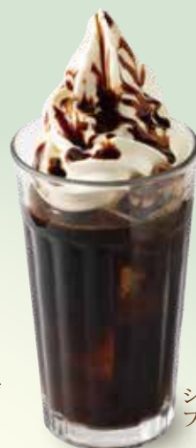
ショコラ フロート