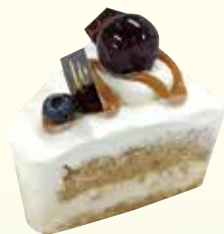
シフォンサンド ¥580 ※本日の味はスタッフに お尋ねください