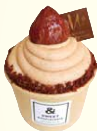
モンブランカップ ¥580