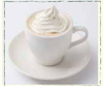
ウインナーコーヒー