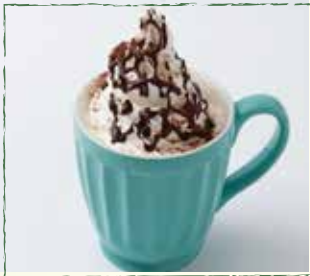
チョコウインナーコーヒー