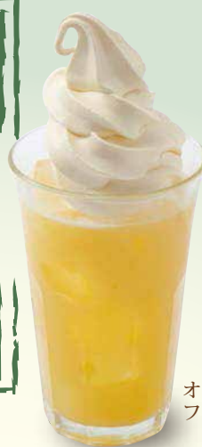
オレンジ フロート