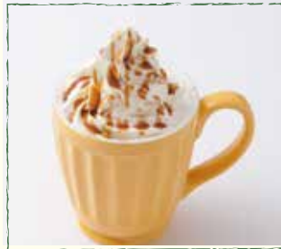
キャラメルウインナーコーヒー