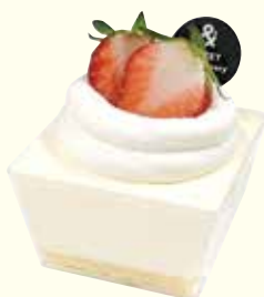
レアチーズケーキ ¥540 ※季節によってフルーツが変わります