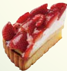
ベリーベリー タルト ¥640