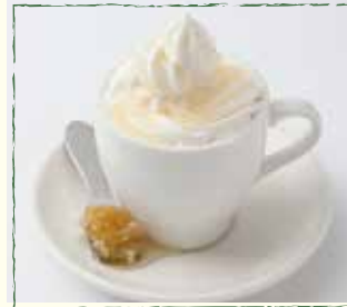
ハチの巣コーヒー