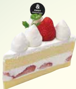
ストロベリーショート ¥680